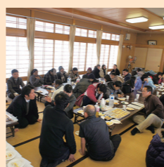
餅の試食会の様子▶

「国際大学の学生の皆さんに地元工場の現場をぜひ見てほしい」という委員からの提案を受け、(株)みやまにおいて、国際大学の学生の皆さんによる餅製造工場の見学と餅の試食会を開催しました。当日は16か国、約50名の留学生が参加し、その様子はNHKの取材を受け、「おはよう日本」で関東甲信越地域に放送されました。参加した学生へのアンケートではほとんどが「面白かった」と回答。餅の一番人気はきなこ、僅差でチーズ&トマトソースでした。