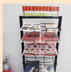
北里学院内の学生食堂入口に設置した情報ラック▶

平成28年度に魚沼基幹病院スタッフを対象に大和商工会が実施した需要動向調査結果を受けて、大和地域内での買い物・サービスに関する情報提供の取組として、魚沼基幹病院、国際大学、北里大学保健衛生専門学院の3施設にチラシやパンフレットによる情報発信ができるようになりました。施設によって設置や配布の方法は異なりますが、これにより、各施設の職員や学生などへの個店情報・イベント開催などの情報提供が可能となりました。