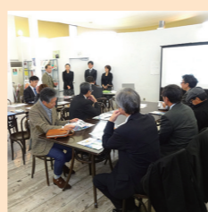
まちなかキャンパス事業について拠点施設「いきいきまちの駅「スマイル」」を視察▶

1泊2日の日程で、群馬・長野両県への視察研修を実施しました。群馬県では、先進医療システムを導入した群馬大学附属病院の状況について、群馬県産業政策課先端医療推進室に話を聞いた後、医療・大学・商業をつなぐ「まちなかキャンパス」事業について、前橋商工会議所に話を聞きました。長野県では、総合病院再編により機能の約2/3が他地域に移転する白田町商工会と、移転するJA長野厚生連佐久総合病院にそれぞれの立場から話を聞きました。